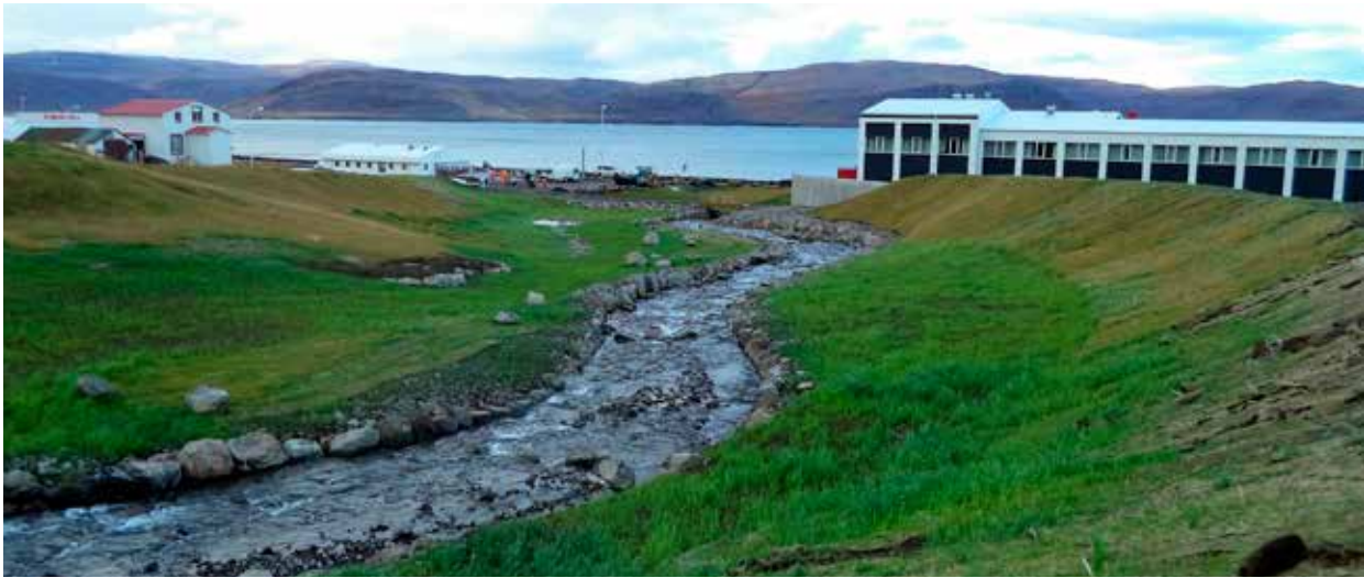
Mynd 2. Nýr árfarvegur Litladalsár mótaður.