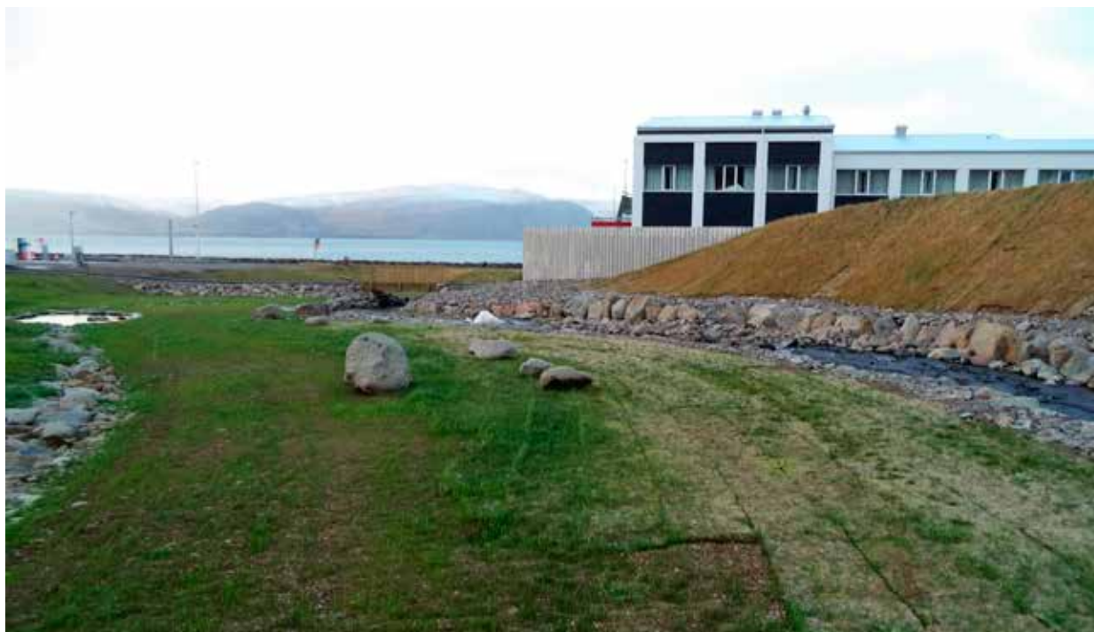
Mynd 6. Leiðigarður og stoðveggur verja hótélbyggingu.