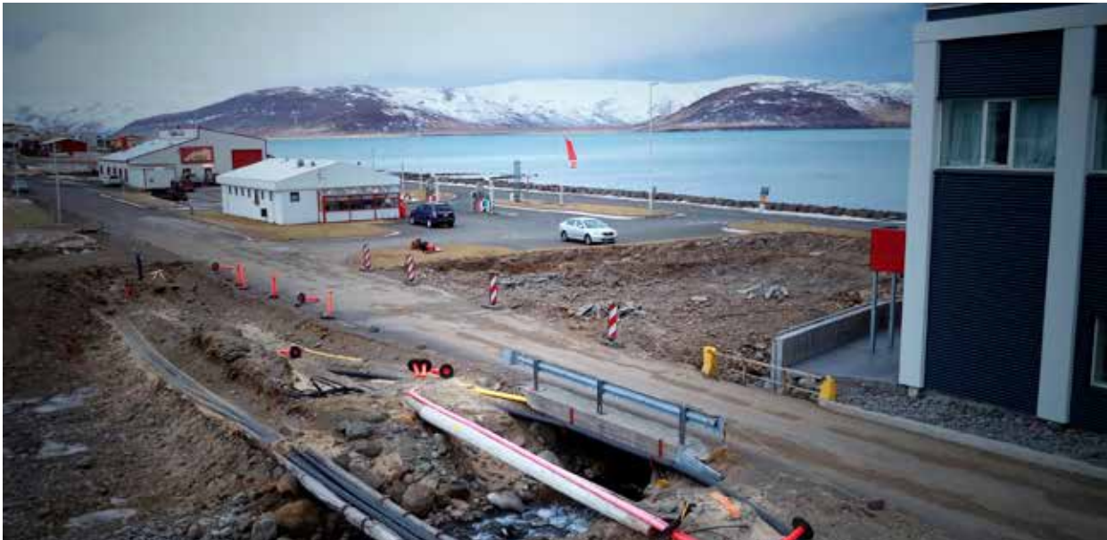
Mynd 4. Færa þurfti lagdir Orkubús Vestfjarða.