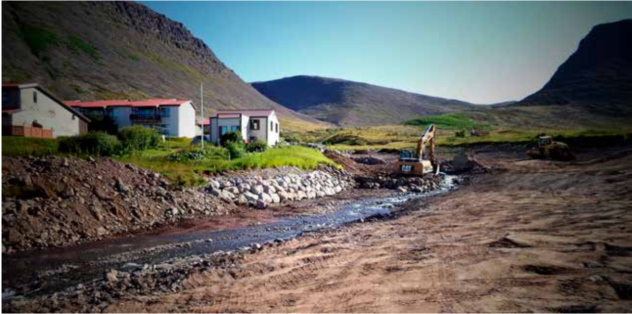
Mynd 1. Unnið við gerð krapaflóðsvarna í Litladalsá á Patreksfirði.