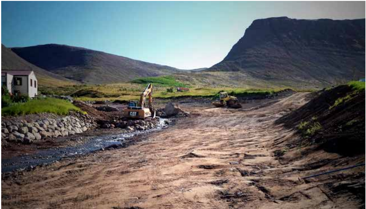
Mynd 7. Littadalsá eftir dýpkun dalsins, fyrir sáningu.