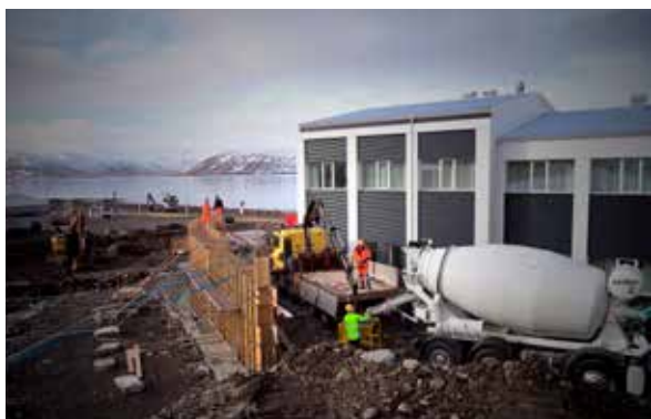
Mynd 5. Stoðveggur við Fosshótel steypdur.

Þann 16. september 2014 lauk Orkubú Vestfjarða loks við færslu lagna. Þá var Aðalstræti strax í framhaldinu rofið og brú rifin og Vesturbyggð gat hafið byggingu á stoðvegg við Fosshótel. Verktaki fór í þann frágang í dalnum sem hægt var að framkvæma um sumarið 2014, þ.e. þökulagningu, grjóthleðslu o.fl., en vegna framangreindra tafa lenti verktaki með endanlega frágangsvinnu þegar vetur konungur í garð gekk.