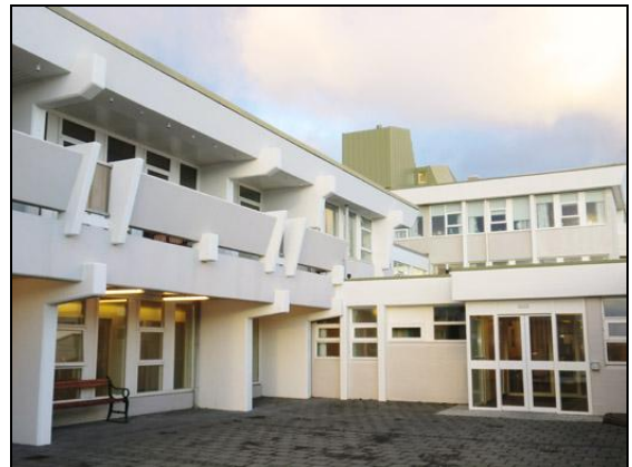
Anddyri Heilbrigðisstofnunar Suðurnesja.