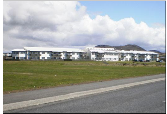
Víðihlíð í Grindavík.