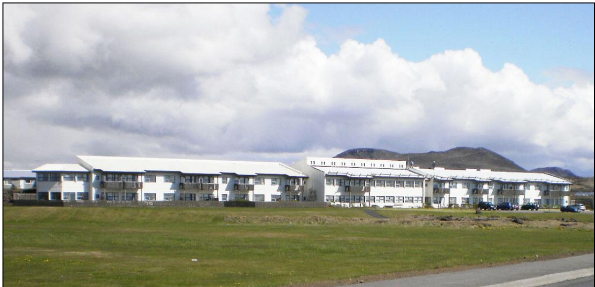
Víðihlíð í Grindavík.