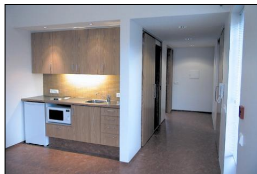
Frágangur allur er hinn vandaðasti