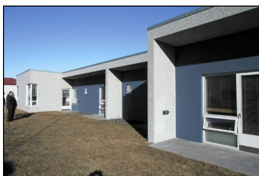
Þak er steipt og pappalagt