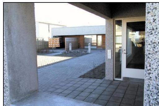
Lóð er glæsileg