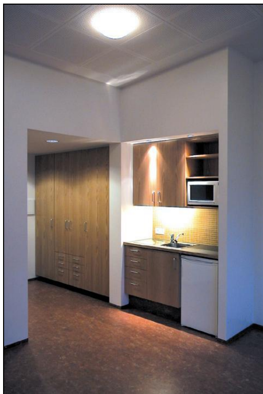
Eldhúskrókur einnar íbúðareiningarinnar

Húsið er steinsteypt, ein hæð, 410m 2 að grunnfleti og 1505,3m 3 . Íbúðareiningar eru 6, ásamt sameiginlegum stofum og þjónusturými. Útboðið tók til byggingar og fullnaðarfrágangs hússins ásamt lóð. Gengið var frá bílastæðum, hellulögnum og gróðri. Húsið er einangrað að innan og múrhúðað. Þakið er steinsteypt, lagt pappa, einangrað ofan á og fergt með steinhellum. Burðarveggir og skilveggir milli íbúða eru steinsteyptir en allir léttir veggir eru hlaðnir úr vikursteini og múrhúðaðir. Tekið var tillit til ýtrustu sjónarmiða um ferlimál fatlaðra innanhúss sem utan.