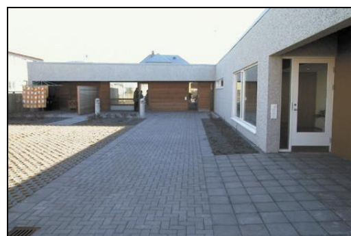
Garðurinn er mjög stór