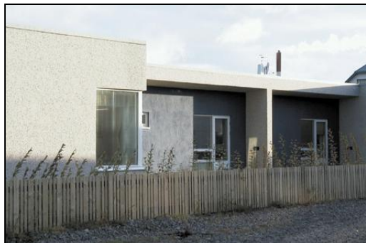
Hægt er að ganga út í garð úr öllum íbúðunum

Með byggingu nýs sambýlis á Akranesi var komið til móts við mikla þörf fyrir aðstöðu til handa fötluðum einstaklingum. Íbúar Laugarbrautar 8 og aðstandendur þeirra eru mjög ánægðir með húsnæðið sem stendur undir þeim væntingum sem til þess voru gerðar.