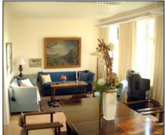
Stærri fundarsalur á efri hæð

Verkframkvæmdin tókst vel í alla staði og stóðust bæði tímasetningar og áætlaður kostnaður. Að lokinni verkframkvæmd ákvað menntamálaráðuneytið að kaupa lausan búnað í hæðina og setja þar antik-húsgögn sem keypt voru að mestu hjá fornsölum.