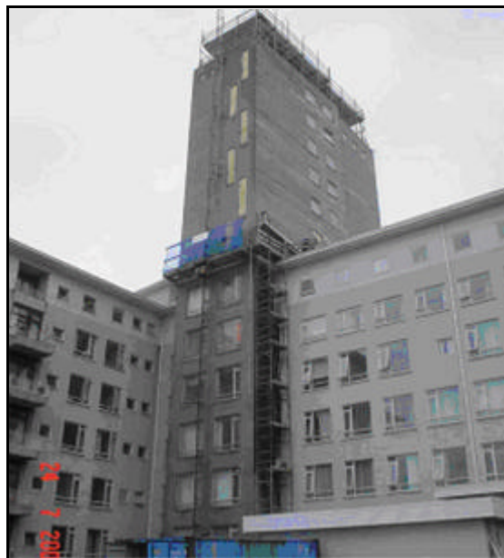
Unnið við endurnýjun glugga á 8. hæð.

Steypuviðgerðir fóru fram á suðurhlið í september.