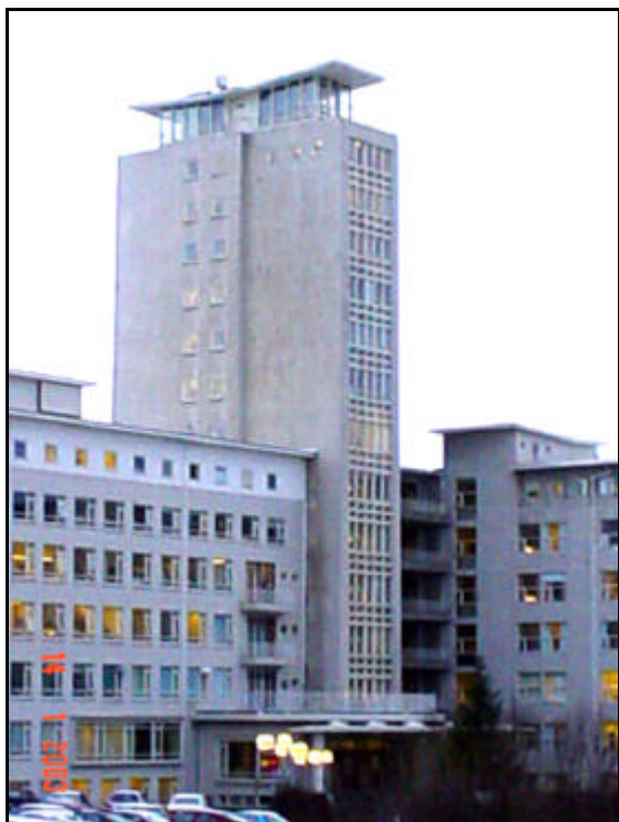
C-álman (turninn) fyrir viðgerðir.

Verkið hófst með uppsetningu á vinnuaðstöðu. Í byrjun verktímans var aðallega unnið við steypuviðgerðir.