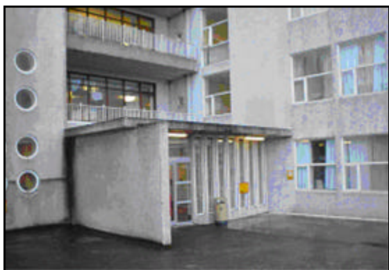
Anddyri á vesturhlíð fyrir viðgerð...