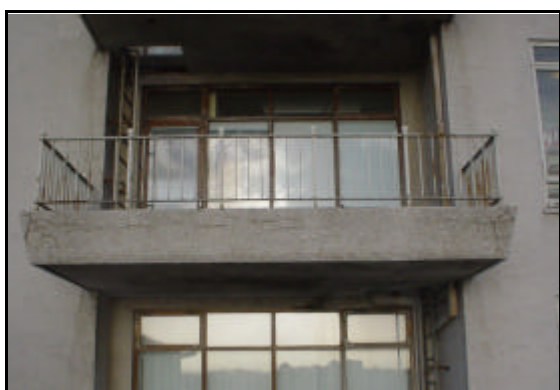
Svalir á suðurhlíð, fyrir viðgerð ...

Verktaki var beittur tafabótum og svo veitti hann afslátt á steiningu á norðurgafli, þar sem áferð á steiningu uppfyllti ekki gæði sem krafist var.