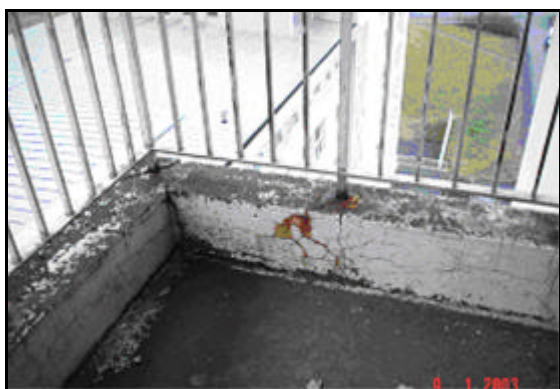
Nærmynd af svölum á suðurhlíð fyrir viðgerð ...