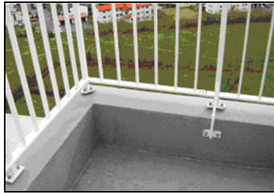
og eftir viðgerð.