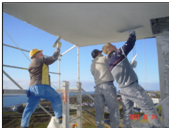
Unnið við jöfnun á steingarlími á svalalofti.

Í október var unnið við jöfnun á steingarlími á svalalofti á suðurhlið og við steiningu á austurhlið um miðjan mánuðinn.