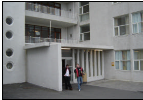
og séð frá sama stað eftir viðgerð.