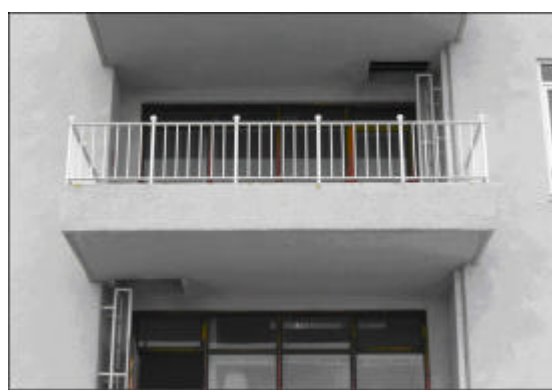
og eftir viðgerð.