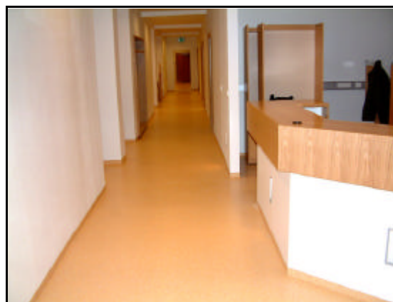
Séð inn gang við móttöku.

Á sama tíma og framkvæmdir á svæði 1a hófust, var vinna hafin við framkvæmdir á svæði 1b. Þegar framkvæmdum á svæði 1a var lokið þá flutti starfsfólk sem hafði skrifstofur á svæði 2 yfir í skrifstofur á svæði 1a. Að því loknu hófst vinna á svæði 2.