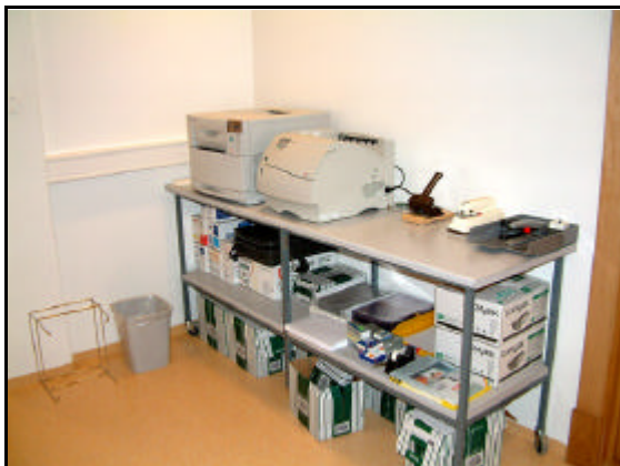
Ljósritun og prentun.

Verkinu lauk með lokaúttekt 23. desember 2003, sem var 7 dögum síðar en veklok í verksamningi. Tafabótum var ekki beitt en fallist var á framlenginu á verkinu vegna aukaverka.