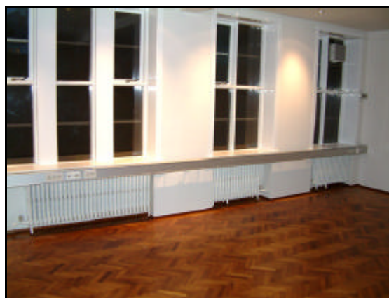
Parket var slípað upp i fundarherbergi og víðar.

Lokaúttekt var gerð þann 23. desember 2003.