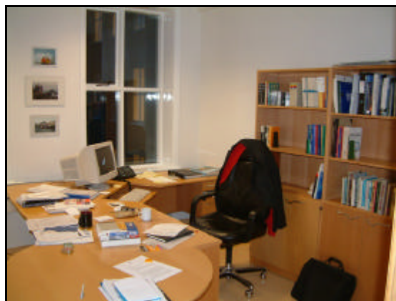
Skrifstofa. eftir endurnýjun.